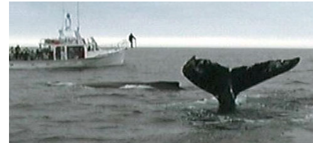
Buckelwale in der Bay of Fundy (Canda) Foto Susanne Rohrbach 2003

In dem Buch werden Erkenntnisse aus dem Training von Orcas in Orlando auf die Führung von Mitarbeitern übertragen. Statt der Gotcha-Praxis sollen Führungskräfte mehr erreichen, wenn sie ihre Kommuni-